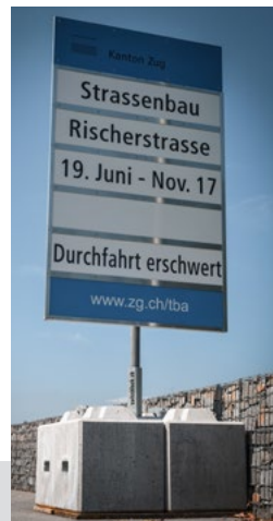
Temporäre Schilder- und Ampelanlagen