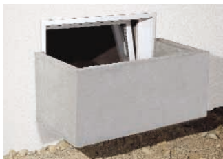
UNIFIX KOMBI-Kellerfenster mit eingehängtem Lichtschacht