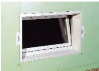
UNIFIX KOMBI-Kellerfenster mit vollständiger Perimeterdämmung und Dämmstoffformteilen für Lichtschacht-Einhängekonsolen