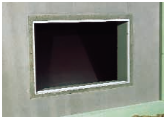
UNIFIX KOMBI-Betonzarge in der Kellerwand