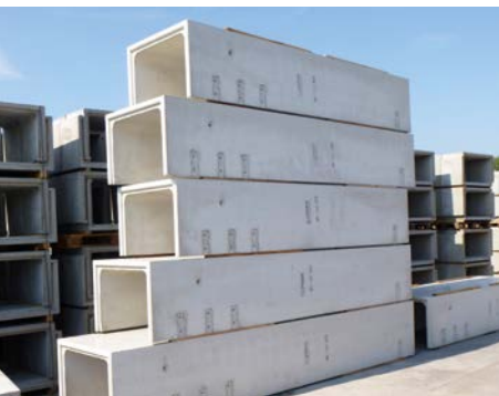
❖❖❖ Sonderlichtschächte mit Einzelteilhöhen von bis zu sechs Metern.

Die Individualfertigung versteht sich dabei als Ergänzung unseres breiten Standard-Sortiments an ausgereiften Systemlösungen für Licht- und Aufzugschächte, Rinnensysteme und Kellerfenster.