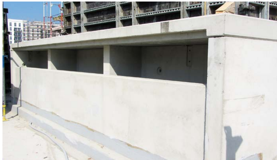
❖❖❖ Sonderlüftungsschächte zur Tiefgaragenentlüftung im Europaviertel in Frankfurt. ❖❖❖