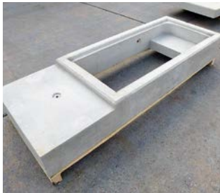
❖❖❖ Individuelle Schachtabdeckung, angepasst an die Fassadenoptik