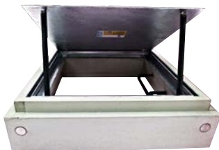
❖❖❖ Spezialanfertigung eines Schachtdoms mit werkseitigem Einbau einer wasserdichten Lichtschachtabdeckung.